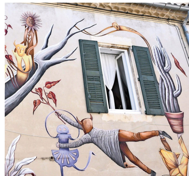
Fresque réalisée dans le cadre de la 7ème édition de « l'expo de ouf » à Nîmes

Les Loyers du parc privé au 1 er janvier 2022